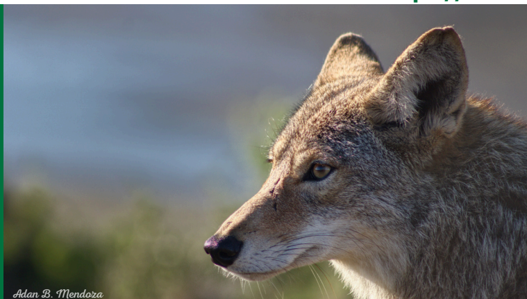
Adan B. Mendoza